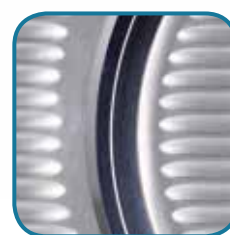
3 RD GENERATION BLADE